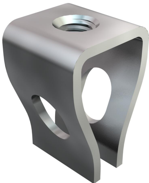
Подвесной зажим M8