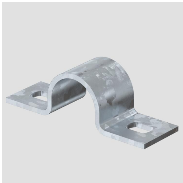
Зажимная скоба с двумя лапками 20 мм