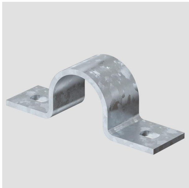
Зажимная скоба с двумя лапками 32 мм