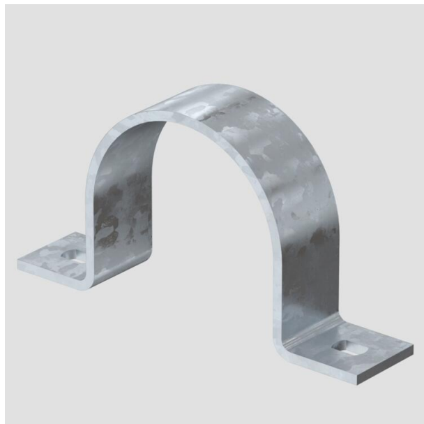
Зажимная скоба с двумя лапками 63 мм